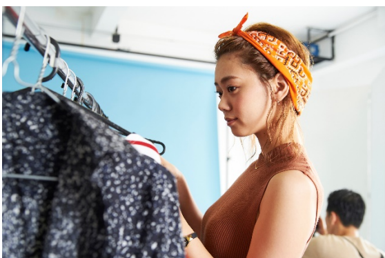
iDA 就業スタッフイメージ※写真スタッフは学生ではありません